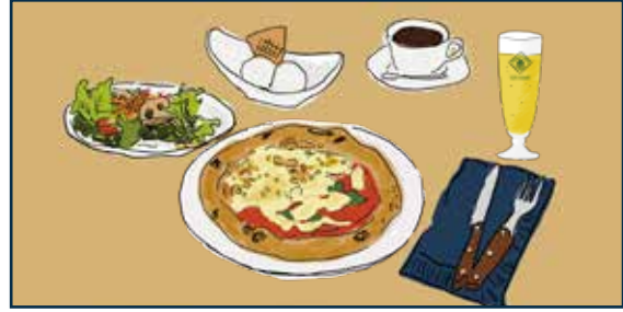
ハーフ&ハーフも選べるピザコース