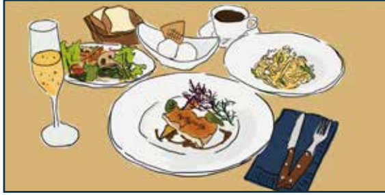
パスタもメインも! とってもお得なランチコース