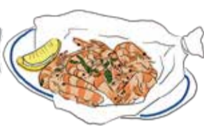
Deep-Fried Whole Shrimp 芝エビのフリット ¥850