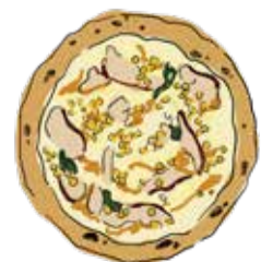
8. Teriyaki Chiken ¥2100 テリヤキチキン チキン/コーン/テリヤキソース/マヨネーズ 大葉/モッツアレラ/パルミジャーノ