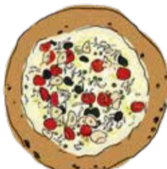
5. Young Sardines ¥2200 ピアンケッティ モッツアレラ/シラス/ニンニク/オリーブ ケッパー/ミニトマト/オレガノ