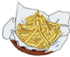
French Fries フライドポテト ¥680