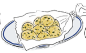
Zeppolini ゼッポリーニ ¥750