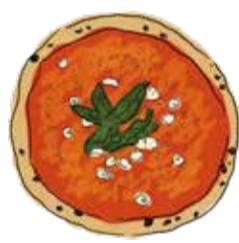
2. Marinara ¥1600 マリナーラ ニンニク/オレガノ/トマトソース/バジル