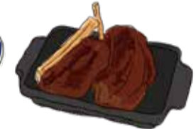
Spicy Roast of Spare Ribs スペアリブのスパイシーロースト ¥1680