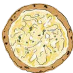
6. Quattro Formaggi ¥2700 クワトロフォルマッジ タレッジオ/ゴルゴンソーラ モッツアレラ/パルミジャーノ