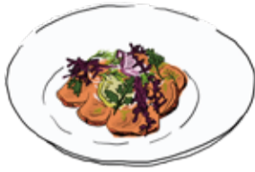
Today's Carpaccio 本日のカルパッチョ ¥1480