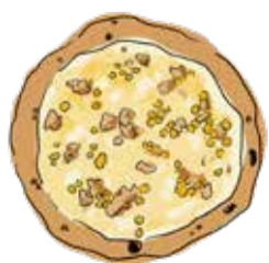
7. Bambino ¥1800 バンビーノ ツナ/マヨネーズ/コーン/モッツアレラ