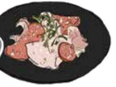
Prosciutto & Salami 生ハムとサラミの盛り合せ S ¥1150/M ¥1950