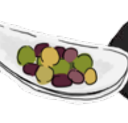
Mix Olive ミックスオリーブ ¥650