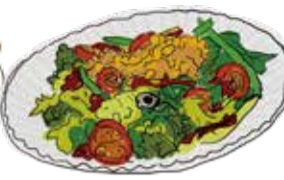
Méli-Mélo Salad メリメロサラダ R ¥980/L ¥1380