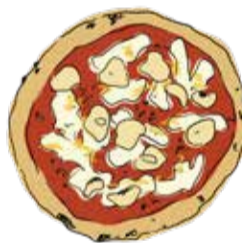
3. Romana ¥1900 ロマーナ ニンニク/アンチョビ/オレガノ モッツアレラ/トマトソース