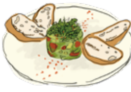
Tuna & Avocado Tartar 三崎漁港直送マグロとアボカドのタルタル ¥1200