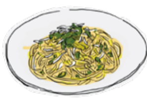
Whitebait & Broccoli Spaghetti シラスとブロッコリーの スパゲッティ R ¥1490 / L ¥2100