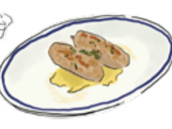
Roasted Salsiccia 生サルシッチャのロースト ¥980