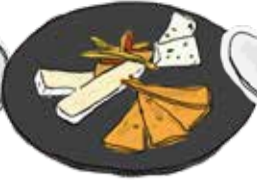
Assorted Cheese チーズの盛り合せ 2kinds ¥950/3kinds ¥1380