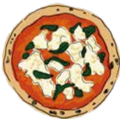
1. Margherita ¥1800 マルゲリータ トマトソース/モッツアレラ/バジル