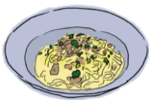
Chicken Ragu & Mushroom Cream Sauce Tagliatelle 鶏ラガーとキノコのクリームソース タリアテッレ R ¥1680 / L ¥2480