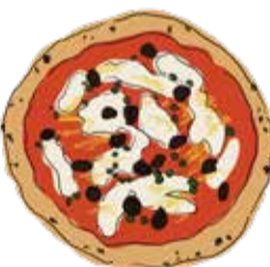
4. Siciliana ¥2000 シチリアーナ オリーブ/アンチョビ/ケッパー/オレガノ モッツアレラ/トマトソース