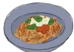
Linguine with Ricotta Cheese & Tomato Sauce 淡路島チーズ工房のリコッタチーズと トマトソースのリングイネ R ¥1680 / L ¥2480