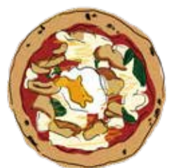
9. Bismarck ¥2200 ビスマルク マレーシアスパイシーチキン/卵/モッツアレラ バジル/トマトソース/パルミジャーノ